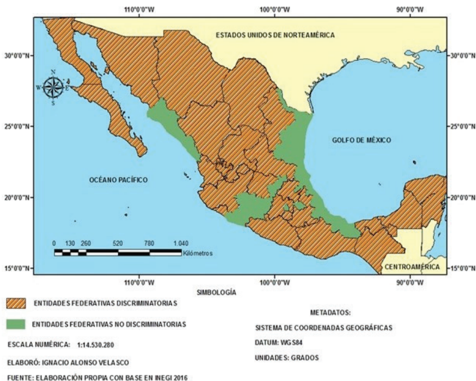
Mapa 3. Distribución geográfica de las entidades federativas en función de que requieran o no, en sus constituciones locales, ser oriundo de México para ostentar una gubernatura

Es de señalar también que para este cargo algunas constituciones locales siguen estableciendo el requisito de tener que ser mexicano de segunda generación, es decir, que no es necesario solamente ser nacido en México, sino que además los dos progenitores han de tener la cualidad de mexicanos (Constitución de Nayarit, artículo 62, fracción I, y de Sonora, artículo 70, fracción I). Incluso, en el Estado de Morelos, se requiere en el artículo 58, fracción I de su Constitución Local “ser mexicano por nacimiento e hijo de madre o padre mexicano por nacimiento”.