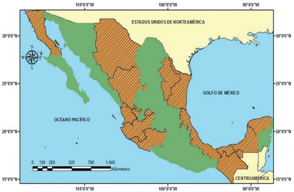
Mapa 2. Distribución geográfica de las entidades federativas en función de si exigen o no, en sus constituciones locales, ser nativo mexicano para poder aspirar a una diputación local

Sin embargo, hay seis Estados (Veracruz, Jalisco, Durango, Chihuahua, Quintana Roo y Estado de México), que no tienen una postura clara y se muestran arbitrarios o antojadizos al respecto, pues no siguen un criterio único a la hora de establecer los mismos requisitos de oriundez para ser miembro de un ayuntamiento que para obtener una diputación.