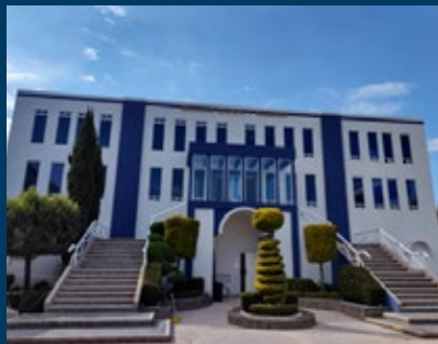
Edificio Central del Instituto Universitario Franco Inglés de México.

El Comité editorial de la revista + Ciencia , agradece al Instituto Universitario Franco Inglés de México la donación de los estuches de herramientas, los cuales se darán como premio al Problema ConCiencia. Muchas gracias por su apoyo a la divulgación científica.