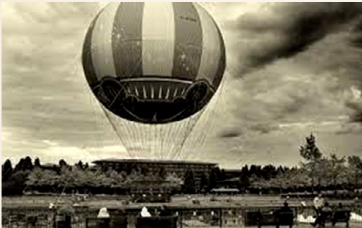
Viajes en globo en 1783.