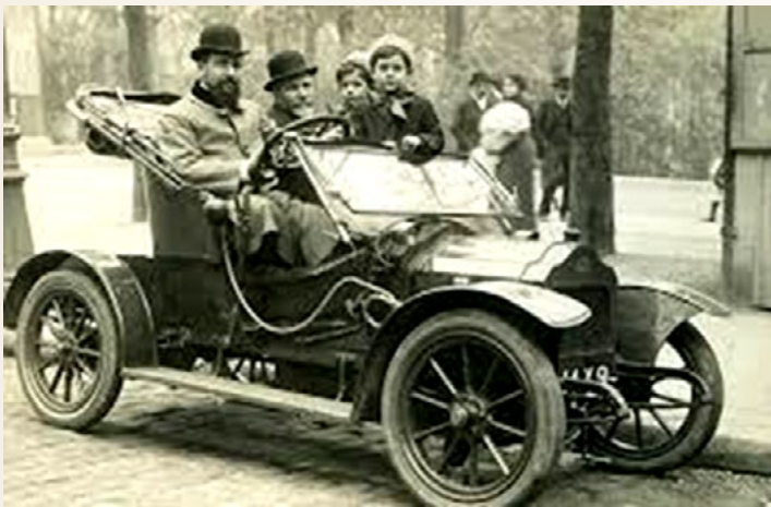
Automóviles de combustión.