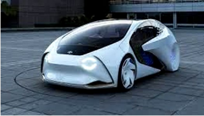
Automóviles autónomos.

En un futuro no muy lejano conoceremos nuevos medios de transporte que nos hagan la vida aún más fácil, práctica y novedosa. Algunos ejemplos pueden ser: aviones transparentes, transportes públicos individuales, coches eléctricos, coches solares, coches sin conductor, vuelos suborbitales, taxi volador, tren por el cielo, entre otros.