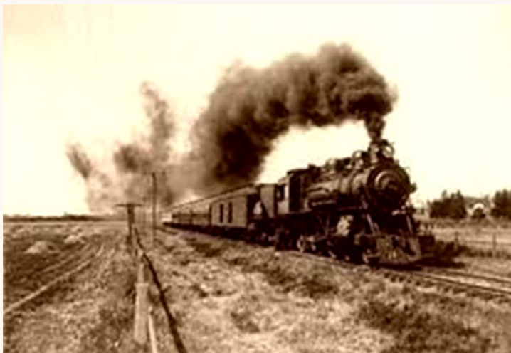
Ferrocarril de vapor impulsado gracias a la Revolución industrial.

Otro elemento que modificó el desarrollo de los medios de transporte fue el vapor, ya que con la llegada de la Revolución industrial tomó el papel principal para la creación de barcos y ferrocarriles, los cuales cambiaron completamente la forma de vida de la sociedad, pues gracias a su conectividad y rapidez, la economía de los países despegó.