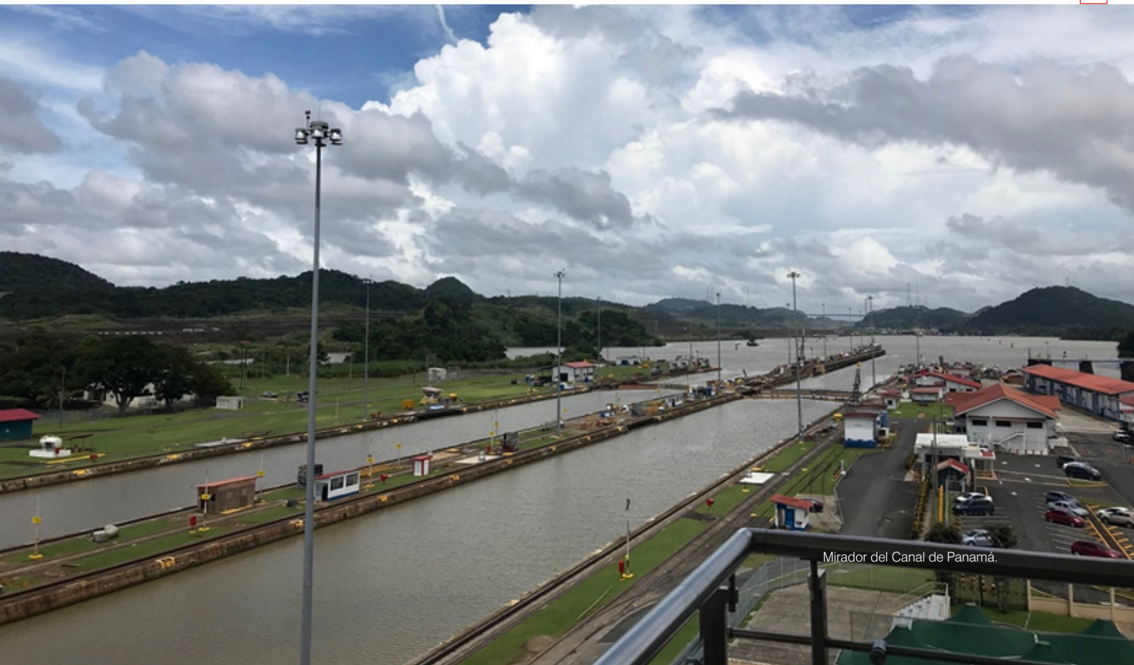
Mirador del Canal de Panamá.

Museo del Canal Interoceánico de Panamá. (2021). Medidas del Canal de Panamá .