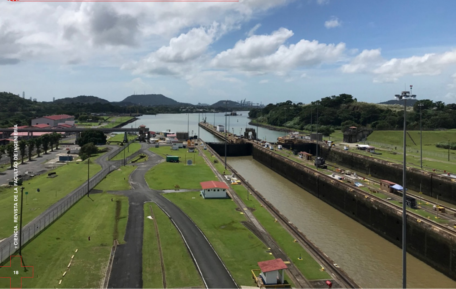
Mirador del Canal de Panamá.