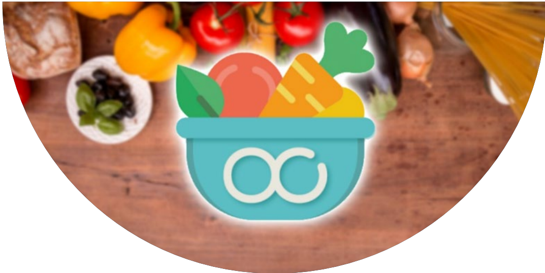
Figura 1. Noodle app.