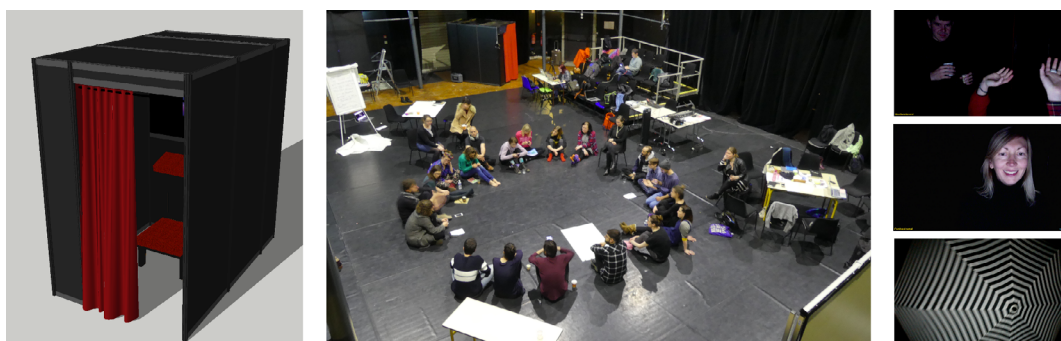
FIGURE 5. LE CONFSSIONNAL. VUE 3D; EN SITUATION (BELFORT 2019); TROIS PHOTOGRAMMES

views. Sur 1300 documents déposés dans divers formats, 7 la quantité varie sensiblement selon les artistes entre 32 et 193 documents. Enfin, le vidéomaton Le Confessionnal a été installé durant le premier workshop à Belfort dans sa version complète, puis dans une version légère pour les transports en avion. Compte tenu de la crise sanitaire, l'installation n'a pu être effectuée lors des derniers laboratoires réalisés en distanciel.