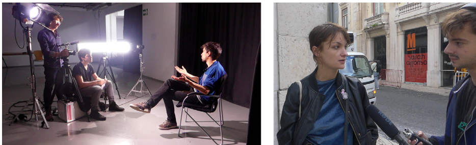
FIGURE 3. INTERVIEW SEMI-DIRECTIVE (GAUCHE), INTERVIEW "SUR LE VIF" (DROITE).